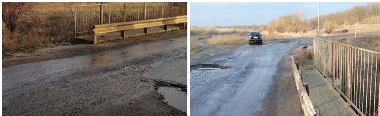
Рисунок 5 – Характерні дефекти дорожнього покриття мостів в зоні деформаційних швів

Варто зазначити, що з точки зору мікропрофілю та його впливу на характер руху автотранспортного засобу (рис. 3), характерний дефект дорожнього покриття мостових переходів виникає в області деформаційних швів (рис. 3, рис. 5).