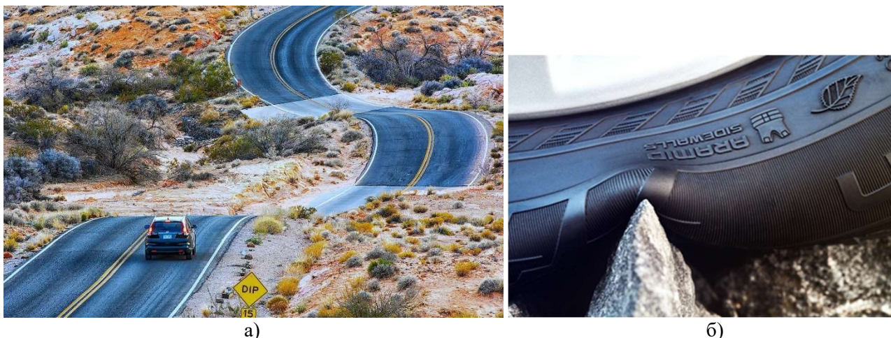
Рисунок 2 – Характер долання автомобілем нерівності макропрофілю (а) та поглинання нерівності його пневматичною шиною (б) [2]

Професор А.П. Солтус наголошує [3], що мікропрофіль опорної поверхні є одним з найбільш суттєвих чинників, який призводить до появи динамічності реакцій в контактні колеса з опорною поверхнею. До того ж мікропрофіль безпосередньо впливає на процес коливання автомобіля [2]. Так, з рисунка 2 видно характер зміни положення центру колеса (непідресорена маса) автотранспортного засобу та його характерної точки на кузові (підресорена маса). Положення зазначених точок до початку долання дефекту дорожнього покриття деформаційного шва мостового переходу наведено на рис. 3, а. Також наведено зміну положення цих точок під час долання від'ємного (рис. 3, б) та додатного (рис. 3, с) кутів атаки [1] дефекту дорожнього покриття.