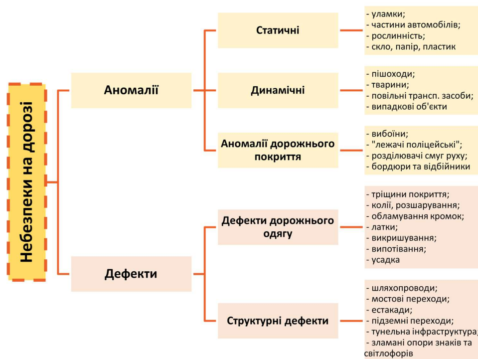
Рисунок 1 – Типи категорій небезпеки на дорозі в контексті виявлення аномалій та дефектів засобами комп'ютерного зору [3]

У роботі [3] представлені результати систематичного огляду автоматизованих підходів та засобів, зокрема методів комп'ютерного бачення, для виявлення дефектів доріг та аномалій, а також їх вплив на безпеку дорожнього руху. Серед основних видів дефектів, які розглядаються в даній роботі можна виділити наступні: вибоїни, тріщини, відшарування, розтріскування, усадка і здуття дорожніх шарів та інші. Дослідники розглядають проблему дефектів та пошкоджень до мостового полотна з точки зору безпеки дорожнього, а також пішохідного руху та наводять наступну класифікацію (рис. 1).